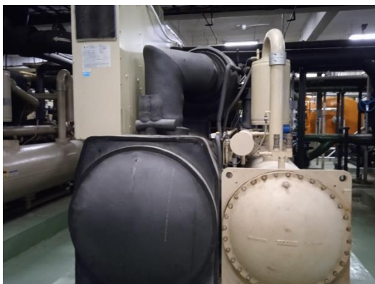
ภาพที่ 3 Chiller