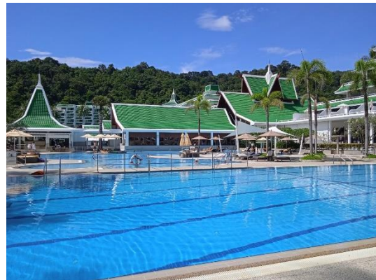
ภาพที่ 26 สระว่ายน้ำ