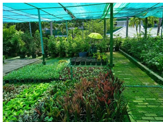
ภาพที่ 30 เรือนเพาะชำ