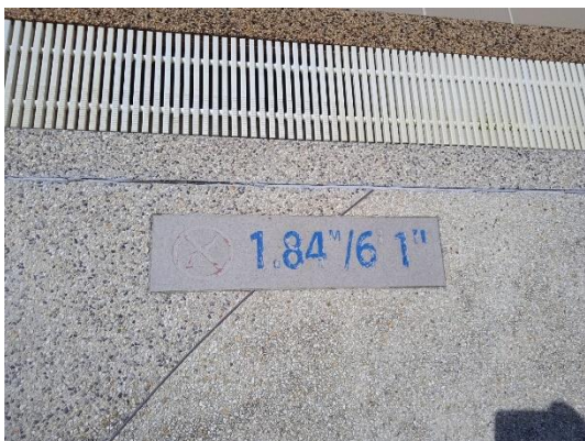
ภาพที่ 27 ป้ายบอกความลึกสระว่ายน้ำ