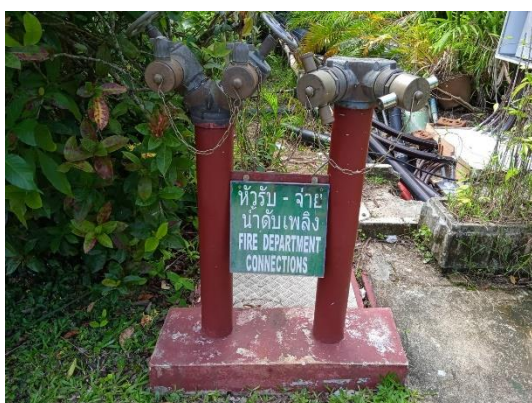
ภาพที่ 11 หวัรับน้ำดับเพลิง