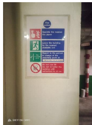
ภาพที่ 4 มาตรการปฏิบัติเมื่อเกิดเหตุไฟไหม้