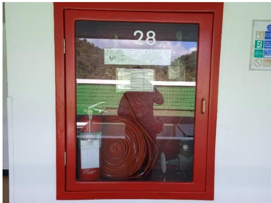
ภาพที่ 7 อุปกรณ์ป้องกันอัคคีภัย

รายงานผลการปฏิบัติตามมาตรการป้องกันและแก้ไขผลกระทบสิ่งแวดล้อม และมาตรการติดตามตรวจสอบคุณภาพสิ่งแวดล้อม (ระยะดำเนินการ) โรงแรม เลอ เมริเดียน ภูเก็ต บีช รีสอร์ท ประจำปีเดือน กรกฎาคม-ธันวาคม พ.ศ. 2566