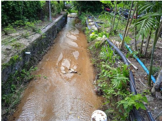
ภาพที่ 1 รางระบายน้ำฝน

รายงานผลการปฏิบัติตามมาตรการป้องกันและแก้ไขผลกระทบสิ่งแวดล้อม และมาตรการติดตามตรวจสอบคุณภาพสิ่งแวดล้อม (ระยะดำเนินการ) โรงแรม เลอ เมริเดียน ภูเก็ต บีช รีสอร์ท ประจำเดือน กรกฎาคม-ธันวาคม พ.ศ. 2566