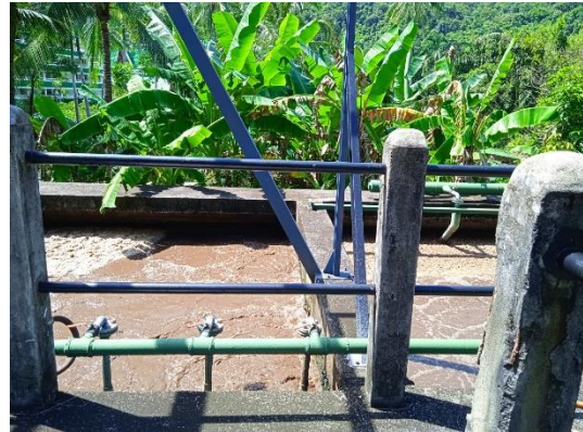
ภาพที่ 2 ระบบบำบัดน้ำเสีย