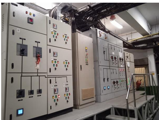
ภาพที่ 35 ตู้ควบคุมระบบไฟฟ้า