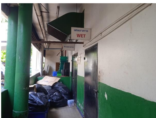
ภาพที่ 23 ห้องพักขยะเปียก