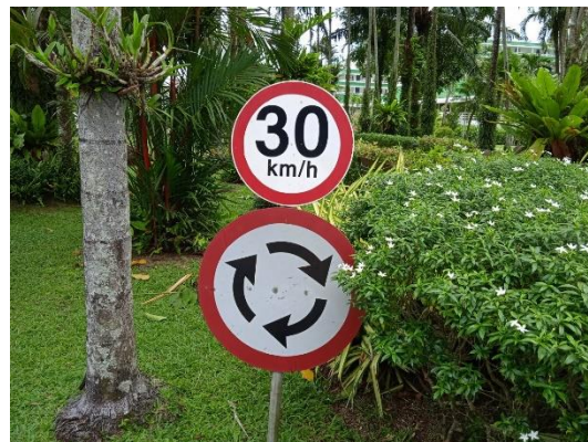
ภาพที่ 20 ป้ายจำกัดความเร็ว