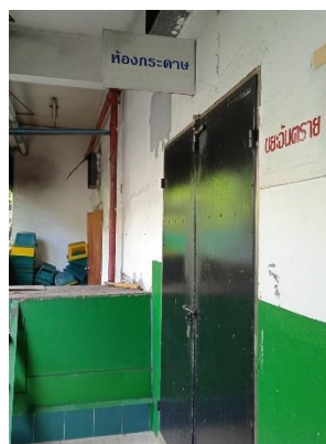
ภาพที่ 22 ห้องพักขยะอันตรายและรีไซเคิล