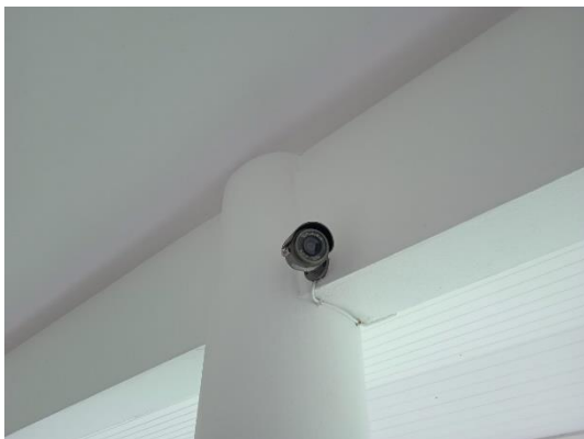
ภาพที่ 31 กล้องวงจรปิด