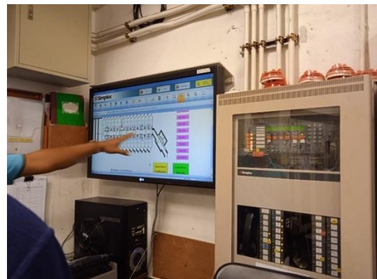
ภาพที่ 18 ห้องควบคุมระบบป้องกันอัคคีภัย