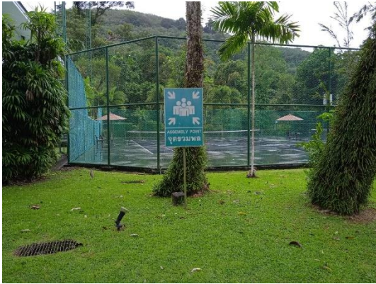
ภาพที่ 13 จุดรวมพล

รายงานผลการปฏิบัติตามมาตรการป้องกันและแก้ไขผลกระทบสิ่งแวดล้อม และมาตรการติดตามตรวจสอบคุณภาพสิ่งแวดล้อม (ระยะดำเนินการ) โรงแรม เลอ เมริเดียน ภูเก็ต บีช รีสอร์ท ประจำเดือน กรกฎาคม-ธันวาคม พ.ศ. 2566