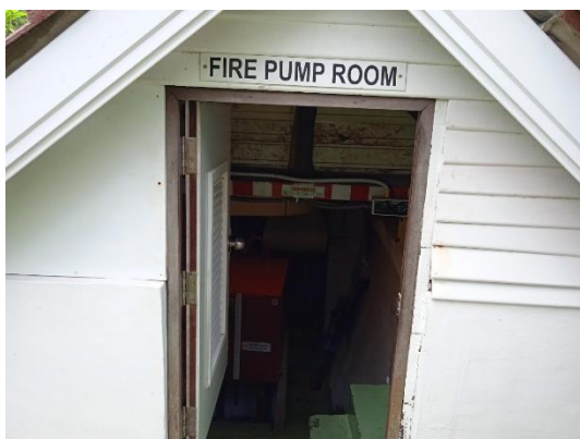
ภาพที่ 9 ป้อนน้ำดับเพลิง