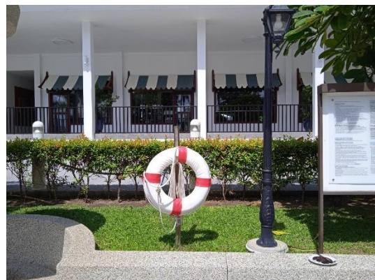
ภาพที่ 28 ห่วงยางชูชีพ