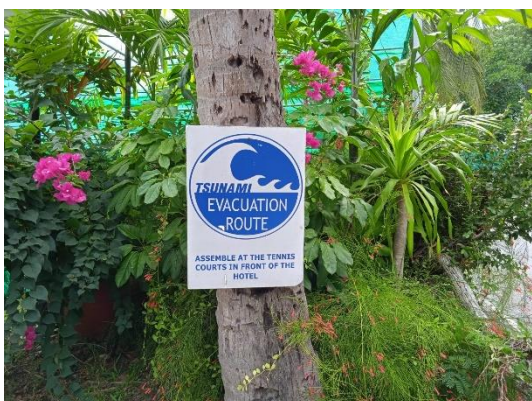
ภาพที่ 5 ป้ายบอกทางหนีคลื่น