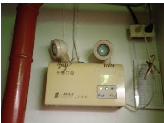
ภาพที่ 29 ไฟส่องสว่างฉุกเฉิน