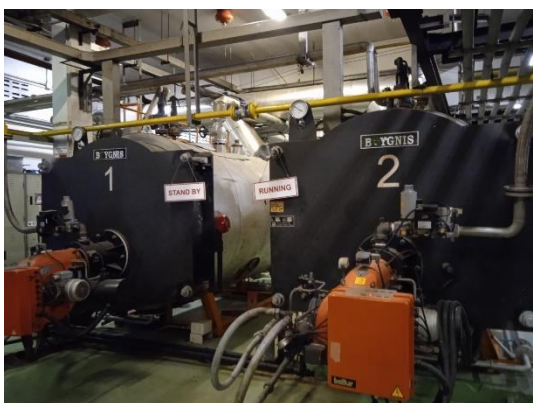
ภาพที่ 21 เครื่องผลิตไอน้ำ (Boiler)