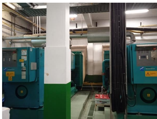
ภาพที่ 36 เครื่องกำเนิดไฟฟ้าสำรอง