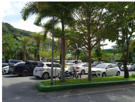
ภาพที่ 32 ลานจอดรถยนต์