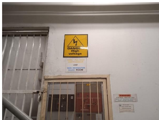
ภาพที่ 34 ป้ายเตือนอันตรายไฟฟ้าแรงสูง