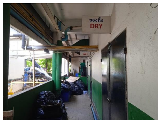
ภาพที่ 24 ห้องพักขยะแห้ง