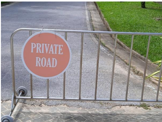
ภาพที่ 15 แผงกั้นทางเข้า-ออกโรงแรม