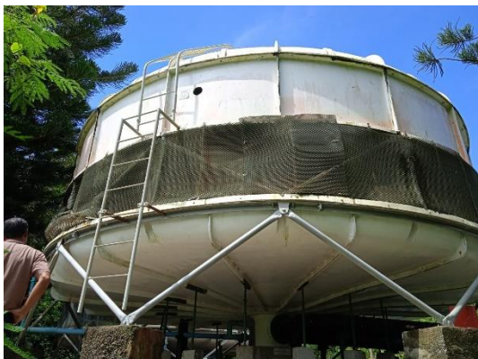
ภาพที่ 19 หอผิ้งเย็น

รายงานผลการปฏิบัติตามมาตรการป้องกันและแก้ไขผลกระทบสิ่งแวดล้อม และมาตรการติดตามตรวจสอบคุณภาพสิ่งแวดล้อม (ระยะดำเนินการ) โรงแรม เลอ เมริเดียน ภูเก็ต บีช รีสอร์ท ประจำปีเดือน กรกฎาคม-ธันวาคม พ.ศ. 2566