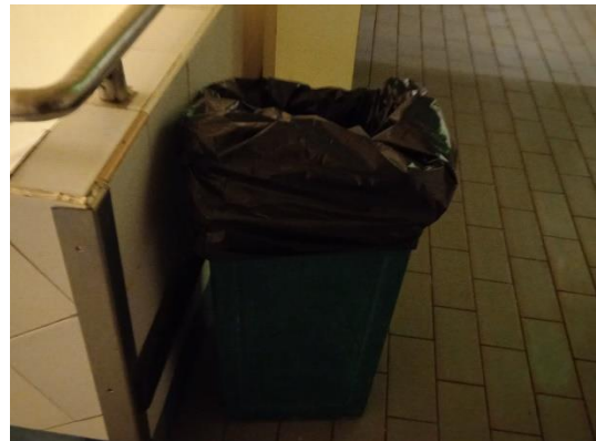
ภาพที่ 8 ถังขยะ