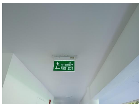
ภาพที่ 12 ป้ายบอกทางหนีไฟ