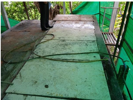
ภาพที่ 17 บ่อตกไขมัน