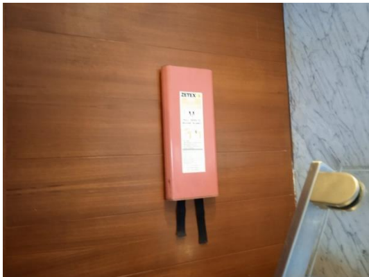
ภาพที่ 25 ผ้าห่มกันไฟ

รายงานผลการปฏิบัติตามมาตรการป้องกันและแก้ไขผลกระทบสิ่งแวดล้อม และมาตรการติดตามตรวจสอบคุณภาพสิ่งแวดล้อม (ระยะดำเนินการ) โรงแรม เลอ เมริเดียน ภูเก็ต บีช รีสอร์ท ประจำเดือน กรกฎาคม-ธันวาคม พ.ศ. 2566