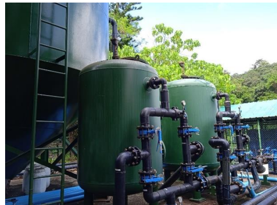
ภาพที่ 16 ระบบปรับปรุงคุณภาพน้ำ