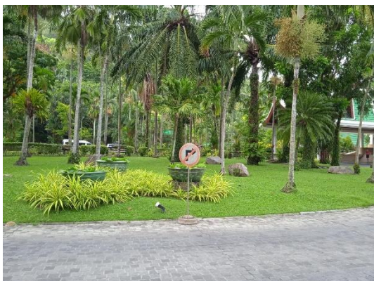
ภาพที่ 33 ป้ายจราจร