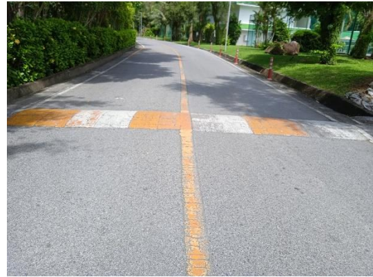
ภาพที่ 14 สันชะลอความเร็ว